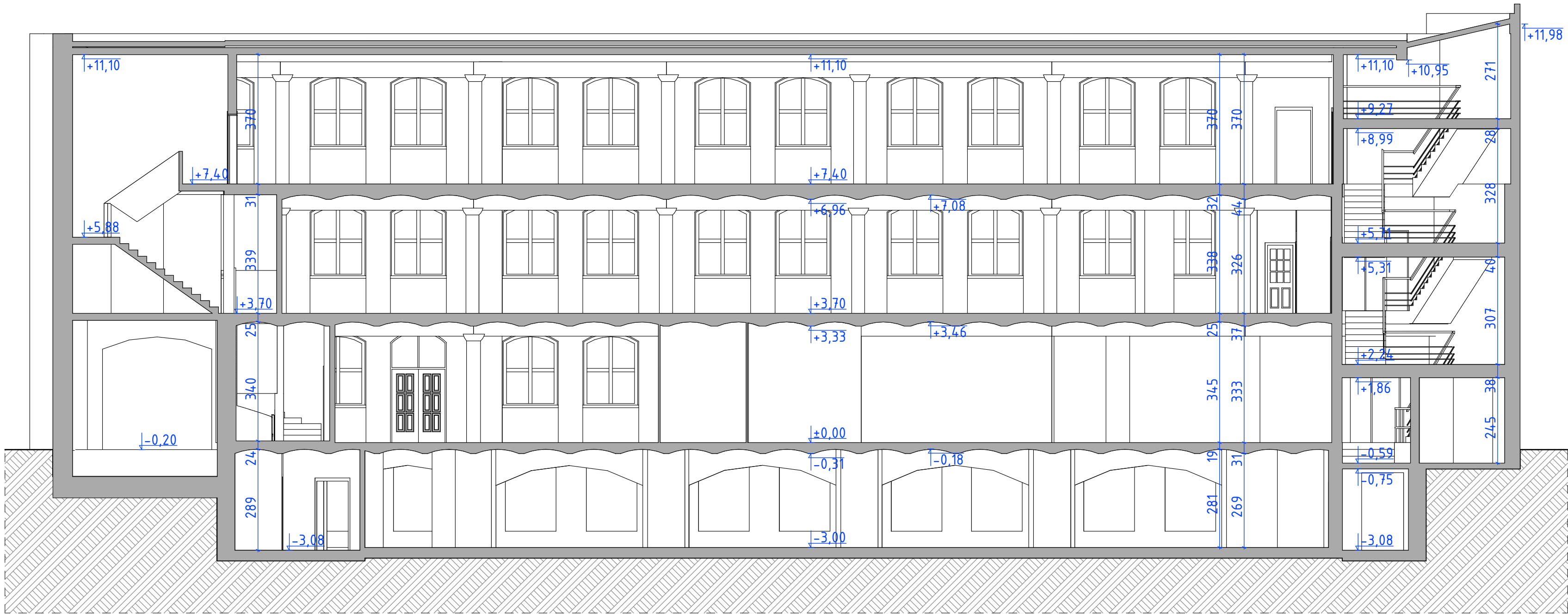
PRZEKRÓJ A-A SKALA 1:100